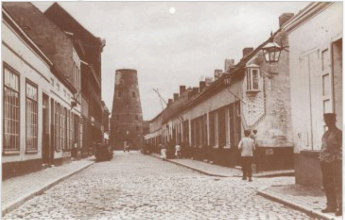
Zicht vanuit de Blijde Inkomststraat.